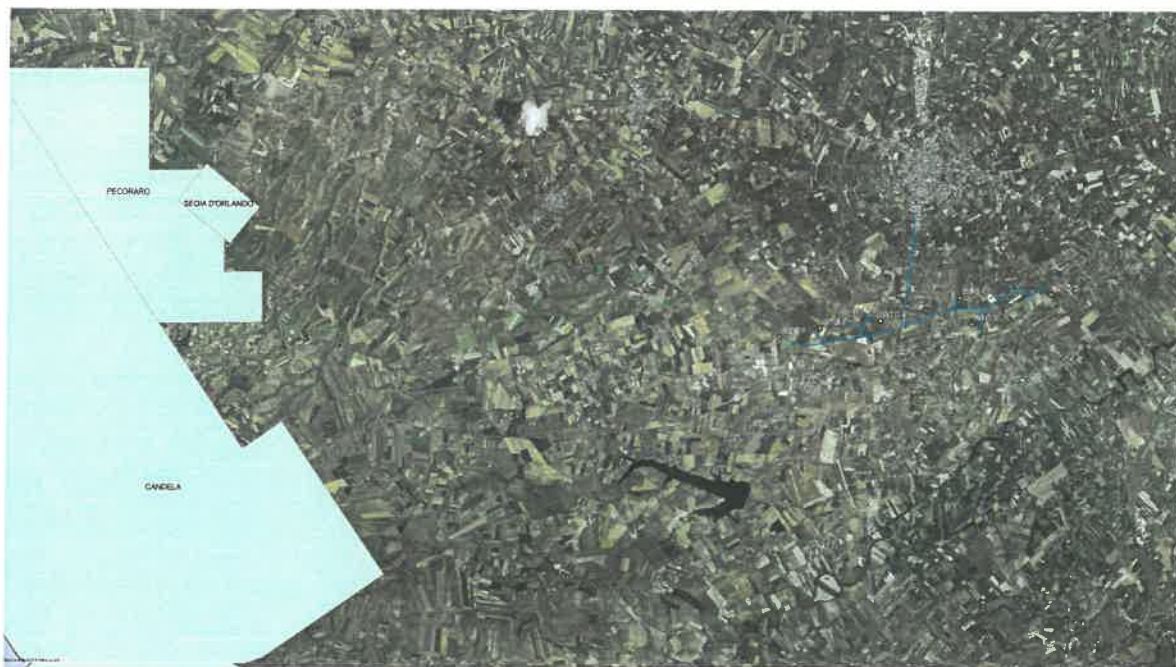
Foto 02: indicazione dell'area oggetto di intervento sulla mappa del MISE in scala 1: 100.000