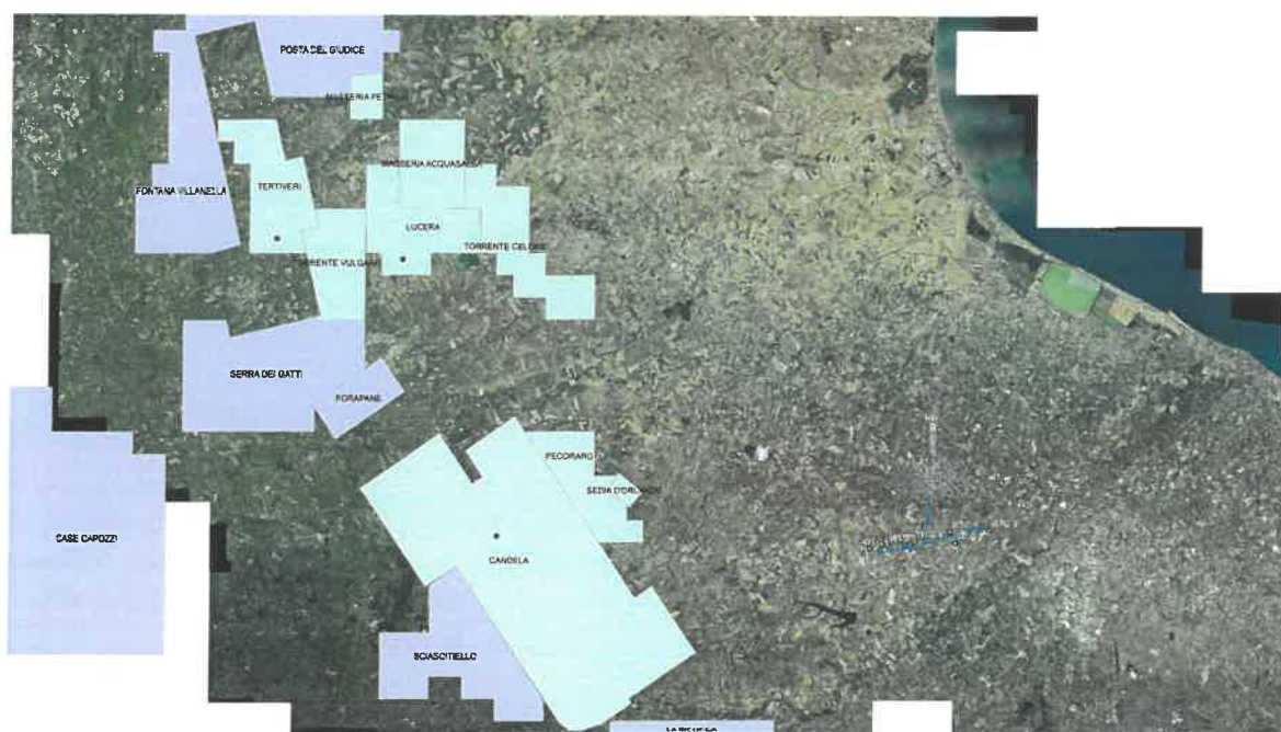
Foto 03: indicazione dell'area oggetto di intervento sulla mappa del MISE in scala 1: 250.000